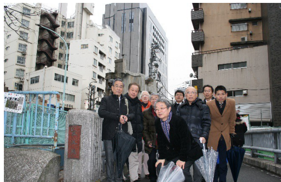
中間点を経過、渋谷橋へ