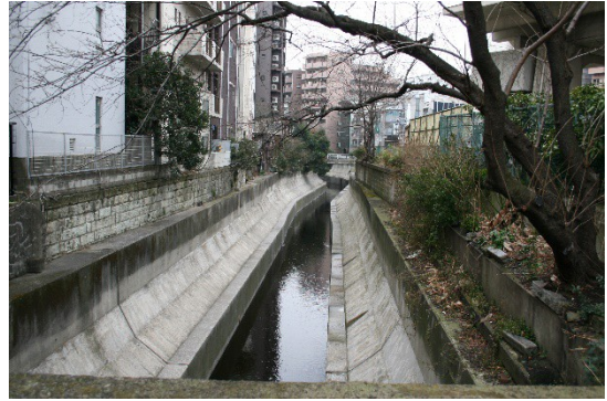
橋の風景：日によって「白鷺」が到来