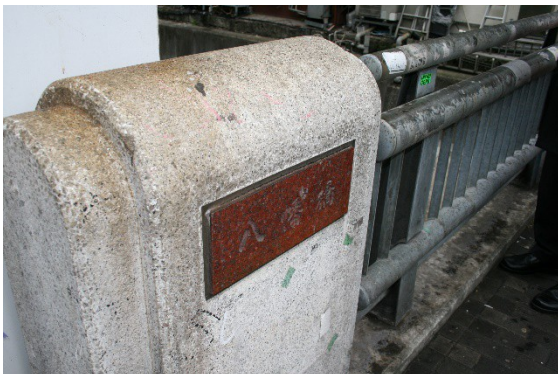
流れの水量は僅か！汚れが気になる