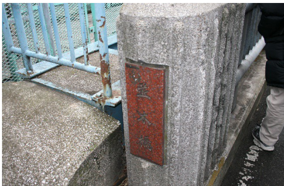
並木橋に到着（六橋目）