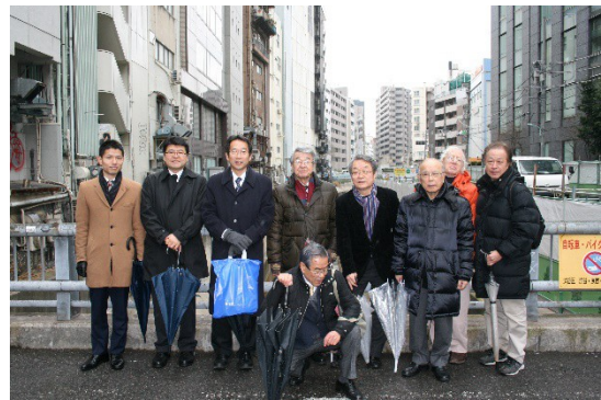
有難く、雨も小休止