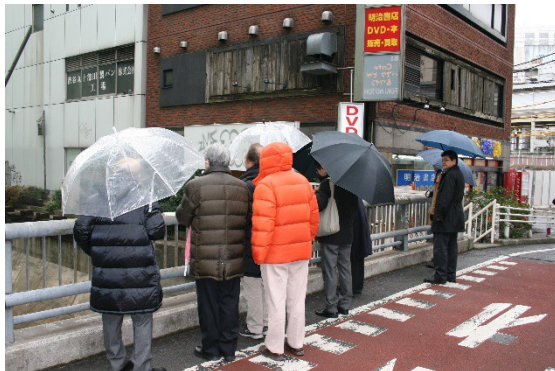
・下流の流れ、橋の数等について説明する